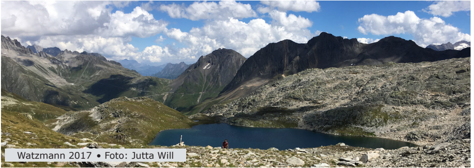
Watzmann 2017