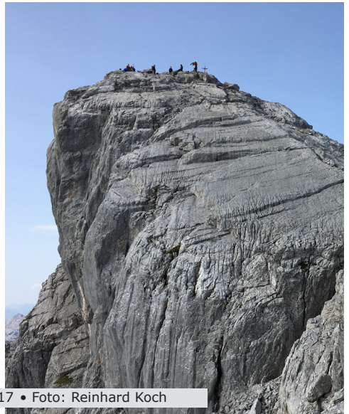
Campingwochenende 2017 • Foto: Reinhard Koch